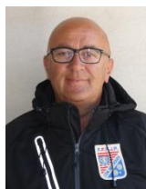
Philippe CATTELET (Conception)